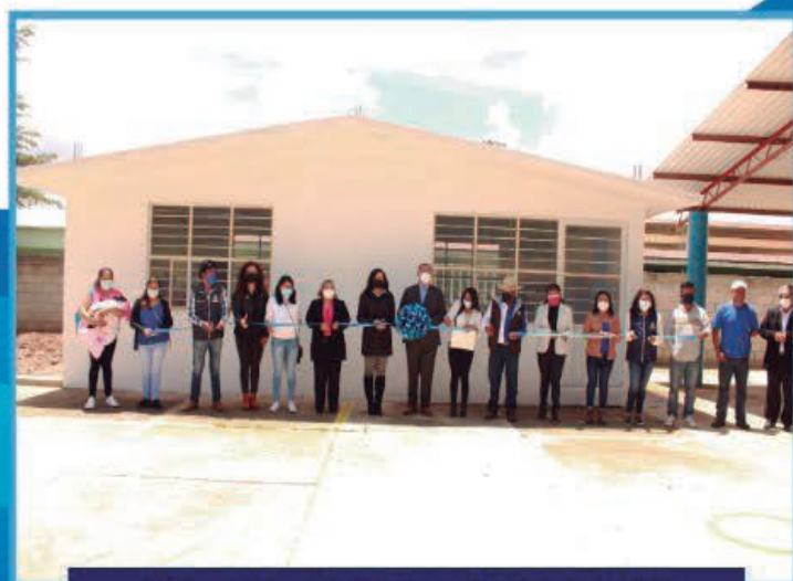
Dongu - Terminación de aula J. N. José Vasconcelos